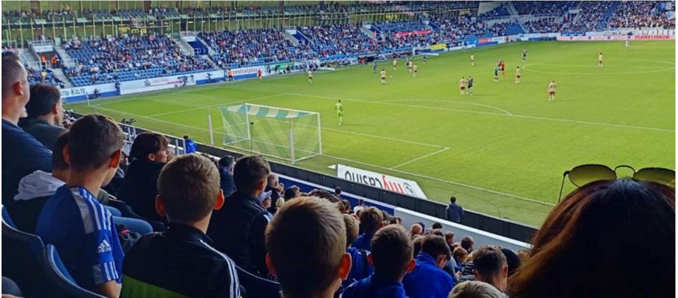
Luzern:Sevette Swisspoorarena Sept. 2023